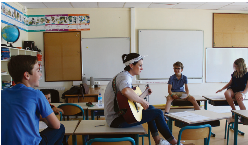
Dans une classe de l'école Tabarly, les élus du Conseil Municipal des enfants répètent leur slam avant son enregistrement.

Ils sont restés à l'école jusqu'à la mi-juillet pour des devoirs de vacances un peu particuliers ! Seize élus du Conseil Municipal des Enfants (CME) ont enregistré un des projets de leur mandat : un clip pour dire stop au harcèlement scolaire. La copie finale doit être rendue en cette rentrée de septembre et la vidéo diffusée dans les écoles de la ville.