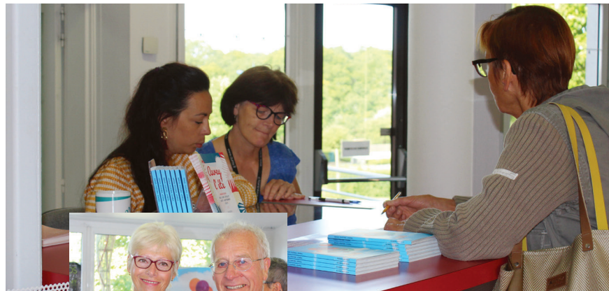
L'ouverture de la billetterie le 21 août dernier.

"La programmation est très éclectique. On est étonnés car on vient d'une ville de plus de 60 000 habitants, Noisy-le-Grand, où il y a un grand centre culturel. Mais pour une ville beau-