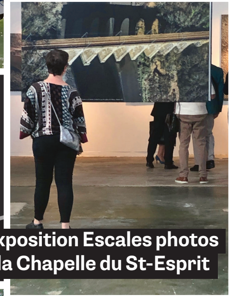
Exposition Escales photos à la Chapelle du St-Esprit