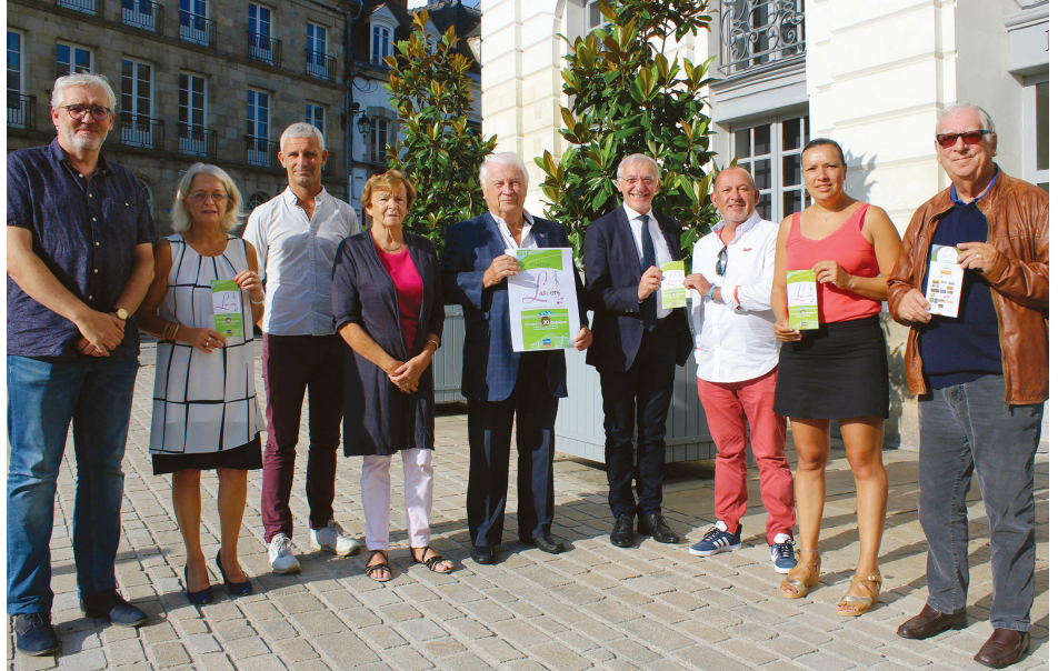
Les organisateurs et partenaires de l'Alréenne, course contre le cancer organisée pour la 1 ère fois à Auray le 20 octobre prochain.