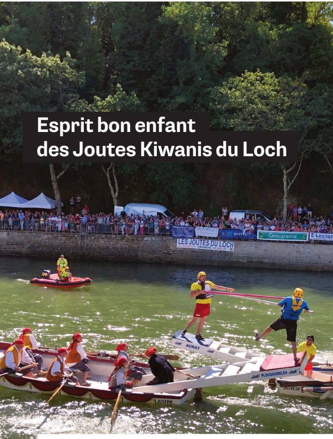
Esprit bon enfant des Joutes Kiwanis du Loch