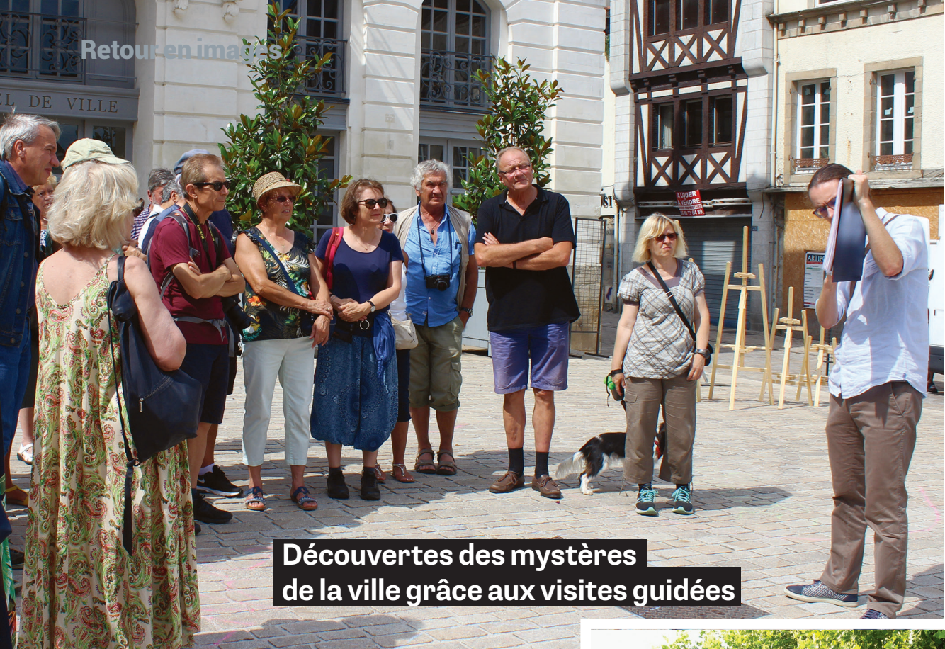
Découvertes des mystères de la ville grâce aux visites guidées