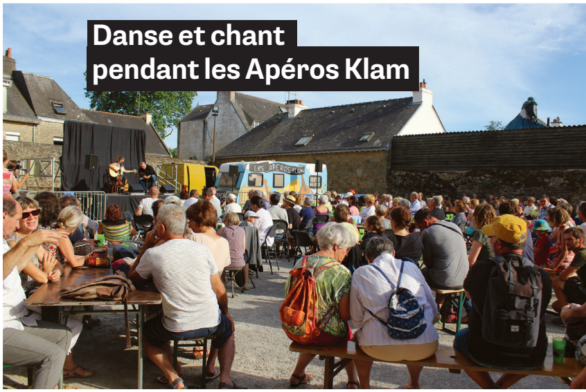
Danse et chant pendant les Apéros Klam