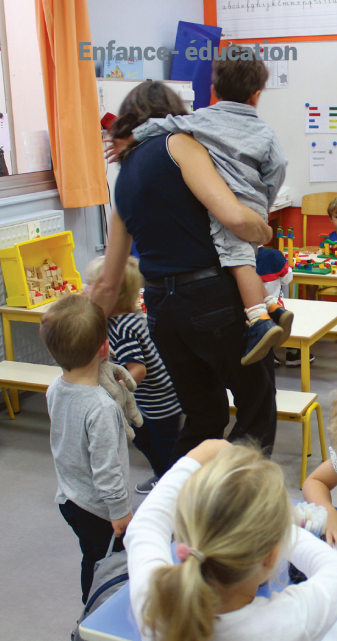
La rentrée à l'école maternelle Saint-Goustan.