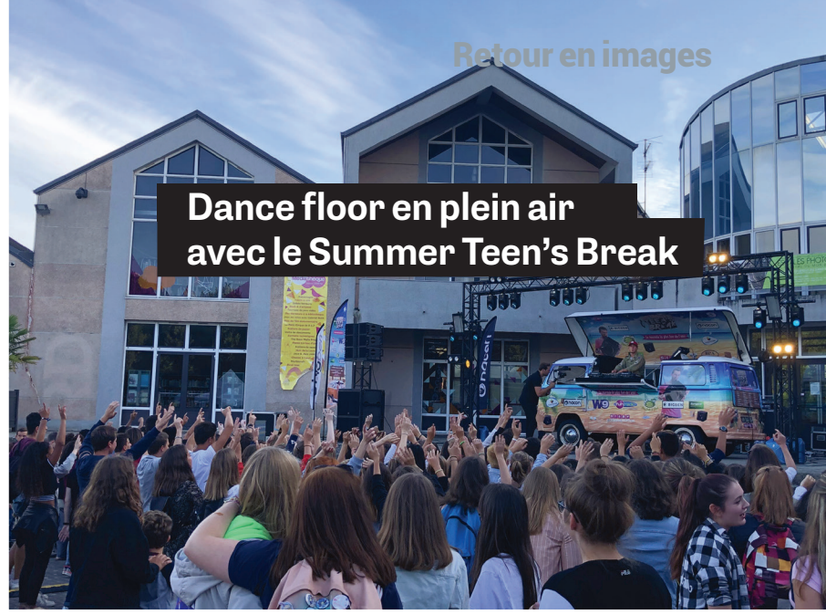
Dance floor en plein air avec le Summer Teen's Break