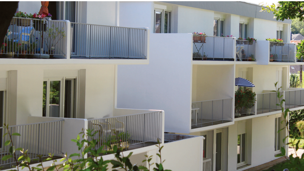
Le bâtiment 2 du Bocéno s'est offert une seconde jeunesse.

Le ravalement et la peinture des façades et balcons du bâtiment 2 ont lancé cet été le programme de travaux à la résidence autonomie Le Bocéno. Ils s'étaleront jusqu'en mars 2020.