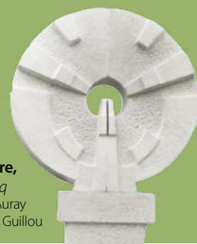
Cadran solaire, Simone Boisecq CES Le Verger, Auray Architecte Yves Guillou

Gratuit • Sur inscription : 02 97 24 18 32 patrimoine@ville-auray.fr Plus d'infos sur www.auray.fr