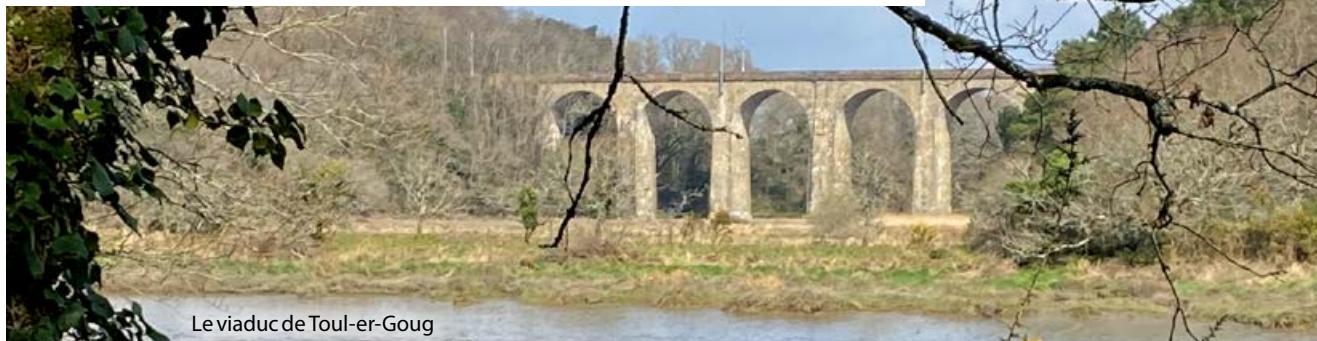
Le viaduc de Toul-er-Goug

Rond-point de la Terre Rouge. On peut imaginer qu'en lisant cela, vous pensez voitures, circulation, sortie ou entrée d'Auray...mais pensez-vous nature, randonnée, calme et sérénité ?