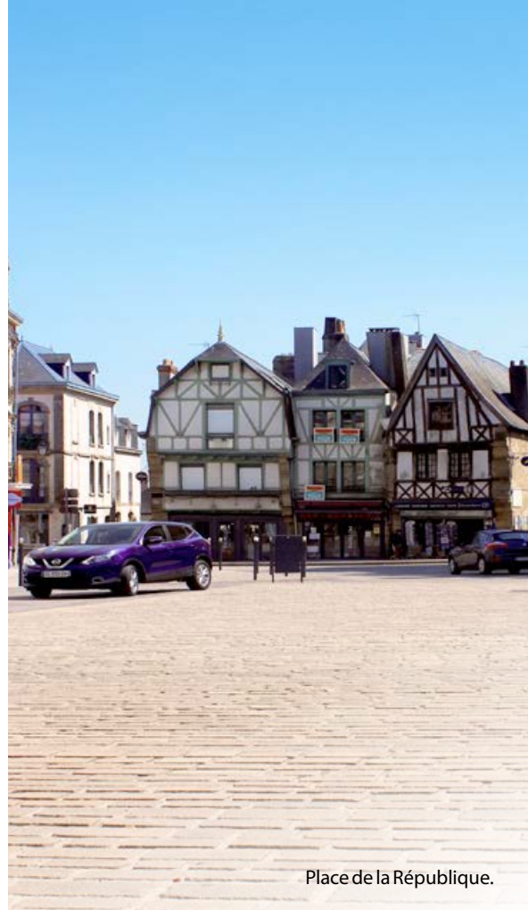
Place de la République.

Le premier de ces tests, d'ores et déjà effectif, est la mise en priorité à droite de la rue Charles de Blois. En mai, la circulation en centre-ville sera modifiée afin de couper la circulation dite « de transit ». Puis une voie partagée entre piétons et cyclistes verra le jour au début de l'été, entre le rond-point du Ballon et les rues Foch et Louis Billet