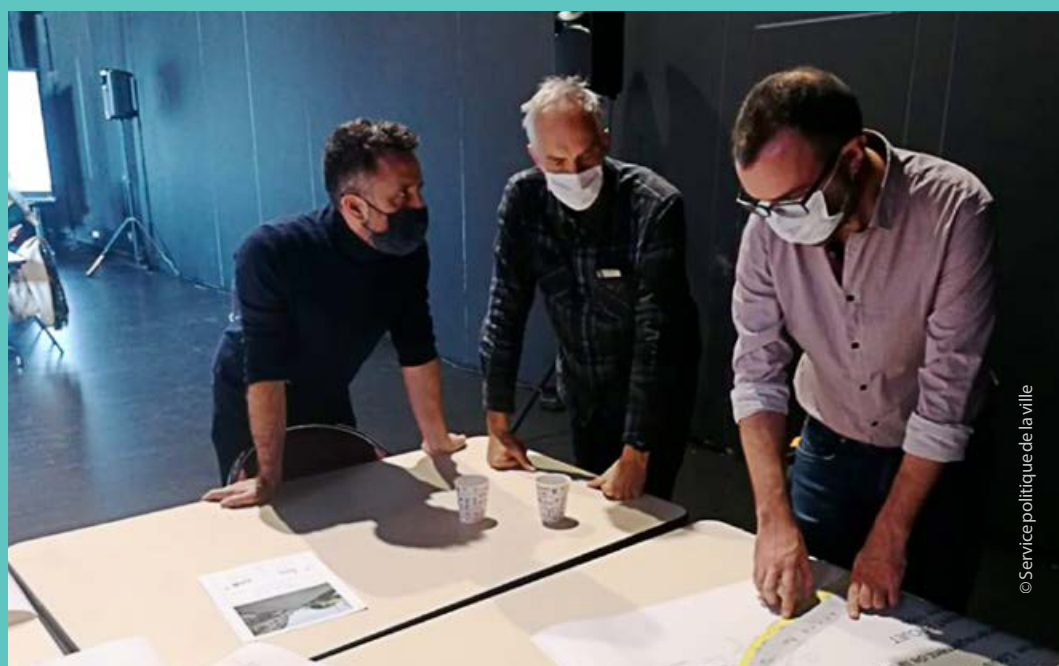
Les Assises de la Mobilité à l'espace Athéna, le 6 mars dernier.