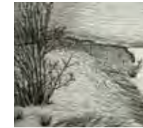
SAUVAGE ORDINAIRE Nastasja Duthois - 2016