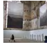
DES VUES Mathilde Seguin - 2015

La Ville d'Auray invite tous les artistes du champ des arts visuels au sens large à proposer un projet artistique original, qui prend en compte la singularité de l'édifice - la Chapelle du Saint-Esprit - et dialogue avec l'environnement du projet, son territoire et/ou ses habitants.