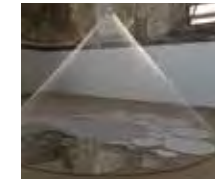
LIEU DE RÉFLEXION Prisca Cosnier - 2017