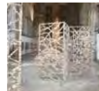
SOUS-BOIS Ladislav Combeuil - 2018