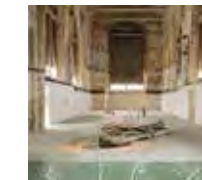
WHEREVER RIVER Maxime Bagni - 2021