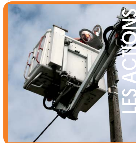
Optimiser l'éclairage public pour réduire la consommation.

Diminuer nos consommations énergétiques et nos gaz à effet de serre, c'est gagner en indépendance vis à vis des énergies fossiles. La Ville a donc choisi :