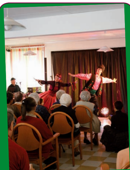
La semaine bleue au foyer logement : les résidents assistent au spectacle du groupe «Swing Girls and Boys», le lundi 12 octobre.

Le goûter dansant Le CCAS organise un goûter dansant, le jeudi 17 décembre, à partir de 15h, à l'Espace Athéna. Gratuit, il est réservé aux Alréennes et Alréens de 65 ans et plus. Les inscriptions, obligatoires, se font auprès du CCAS jusqu'au 11 décembre.