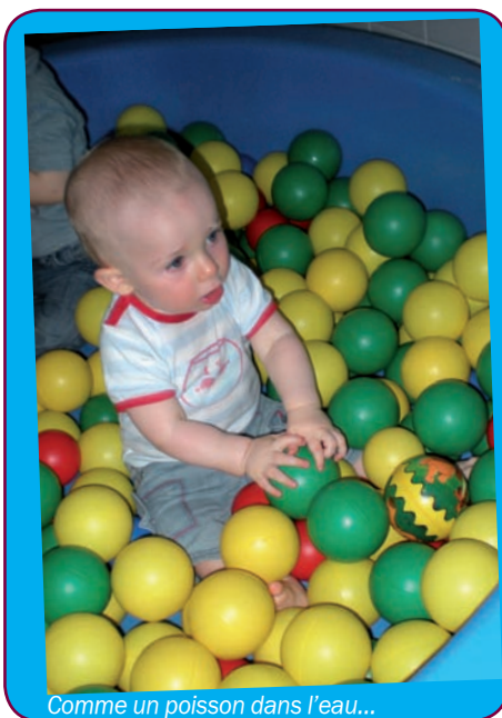
Comme un poisson dans l'eau...

Une autre formule de garde est proposée par le Relais assistantes maternelles (RAM). Il assure le lien entre les parents et les assistantes maternelles ayant reçu l'agrément du Conseil général. Le RAM informe les parents sur leurs droits et devoirs en tant qu'employeur. Des matinées d'éveil sont organisées pour les assistantes maternelles et les enfants.