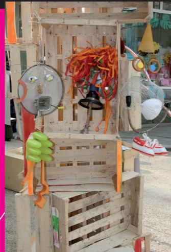
Totem réalisé en 2009 lors d'un atelier de détournement d'objets.

•Les 23 et 24/01/2010, de 10h à 13h et de 14h à 18h ATELIER DE SCULPTURES DE CAGETTES. Objectif : faire une œuvre collective et monumentale autour du transport, qui sera exposée en ville.