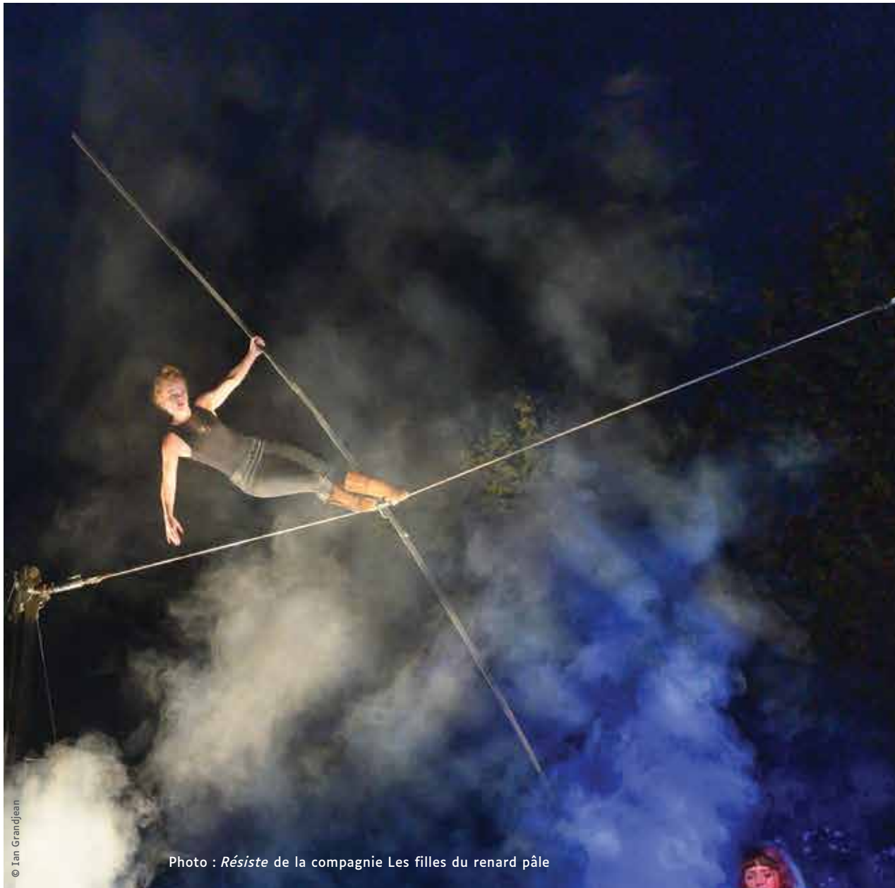
Photo : Résiste de la compagnie Les filles du renard pâle