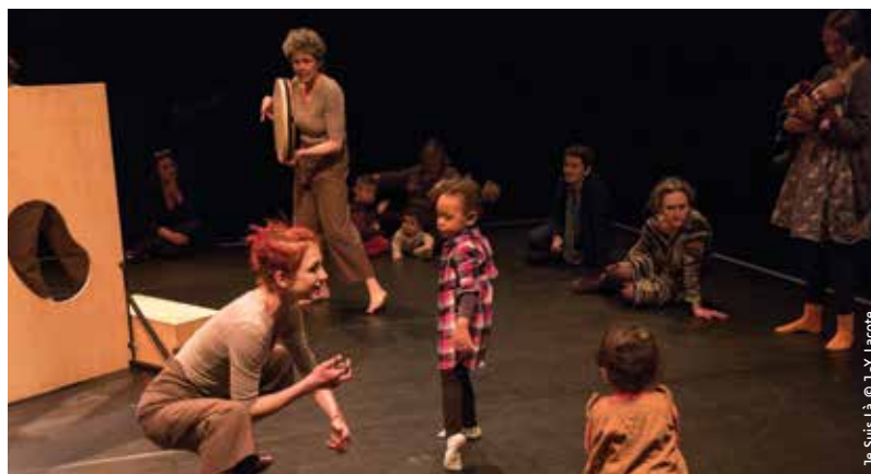
Je Suis Là © J.-Y. Lacote