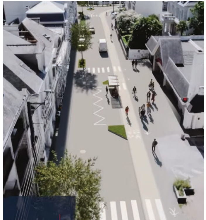
Perspective de l'avenue Foch après travaux (Dripmoon).

On s'en doute, la circulation connaîtra quelques restrictions qui donneront lieu à la mise en place de déviations. Celles-ci seront portées à la connaissance du public en amont des travaux.