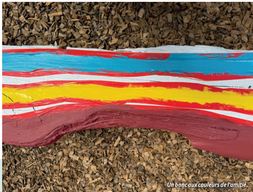
Un banc aux couleurs de l'amitié.