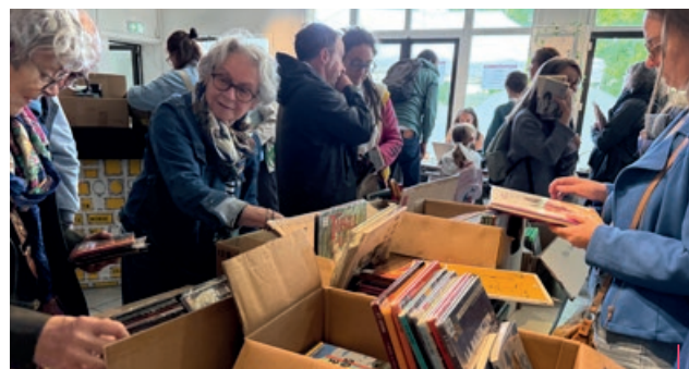
1 € pièce, entre 4 et 5000 documents ont fait le bonheur du public lors de la braderie annuelle de la médiathèque le 6 juin dernier.

Indépendamment de la fermeture des lieux, la médiathèque propose le retour du portage de livres à domicile à destination des personnes dans l'incapacité de se déplacer. Gratuit. Renseignements et inscriptions auprès de Carine ou Emilie. A destination d'un public souffrant de troubles visuels, cognitifs ou dys, une large collection de livres adaptés au format audio est accessible via la bibliothèque numérique Eole . Plus de 70 000 titres sont disponibles. Pour y accéder, il s'agira de prendre rendez-vous aux horaires de ré-ouverture de la médiathèque.