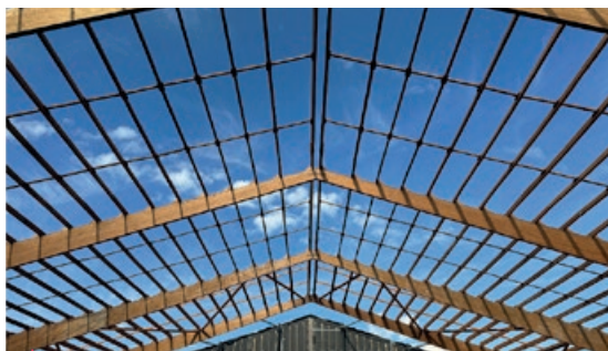
Le bâtiment des courts 2 et 3 désossé a mis à nu une charpente photogénique.

Les jeunes champions de tennis ont inauguré les nouveaux courts 1 et 2 lors de la 39 ème édition de l'Open Super 12.