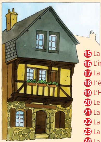
11, rue du Petit Port