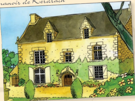
Le manoir de Kerdrain