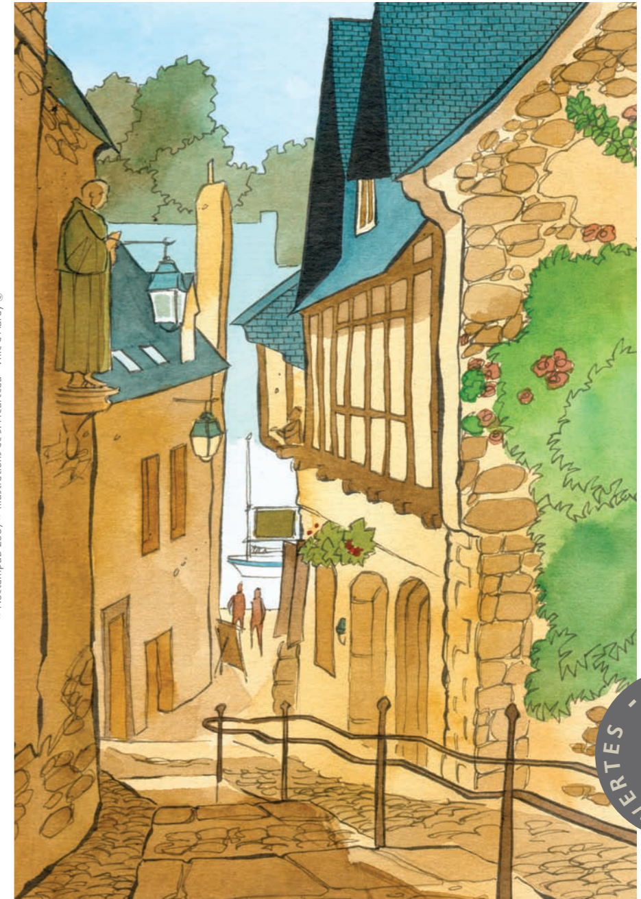
© NoctampiUB 2007 - Illustrations de S. Heurteau - Ville d'Auray