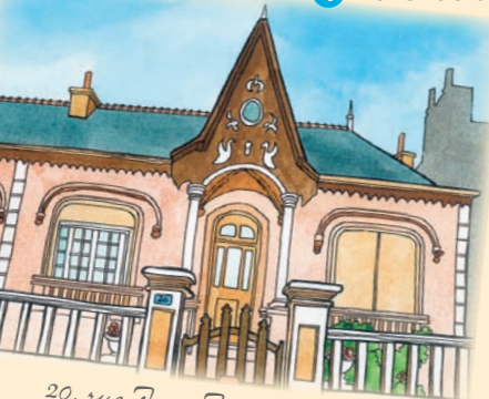
20, rue Jean Jaurès