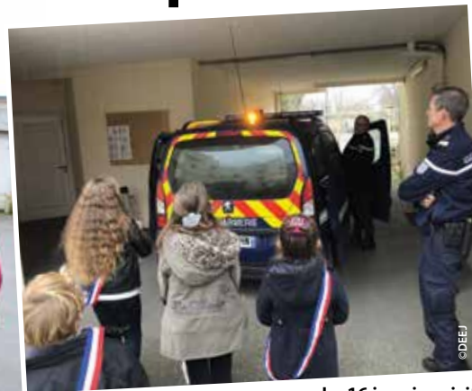
Le 16 janvier visite à la gendarmerie d'Auray.