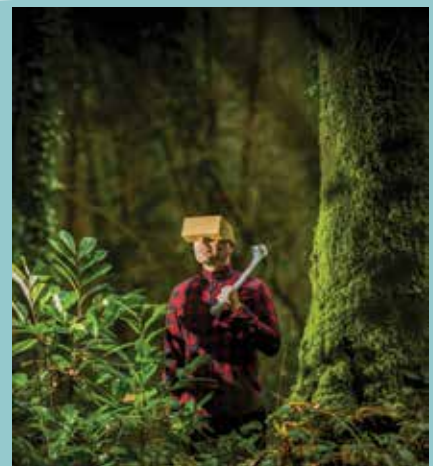
Aïe aïe aïe