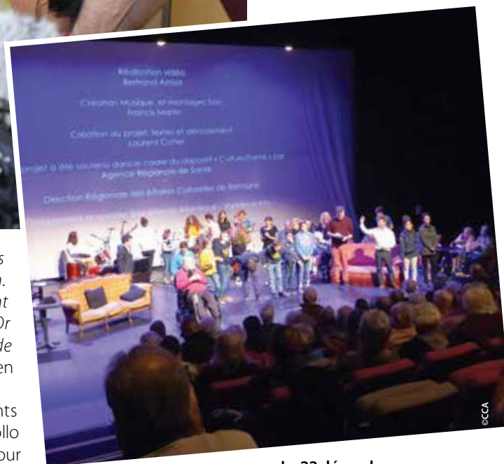
Le 22 décembre, spectacle à l'espace Athéna.