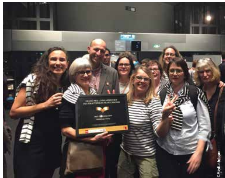
L'équipe de la médiathèque a reçu son prix, le 6 décembre à l'Institut du monde arabe à Paris.