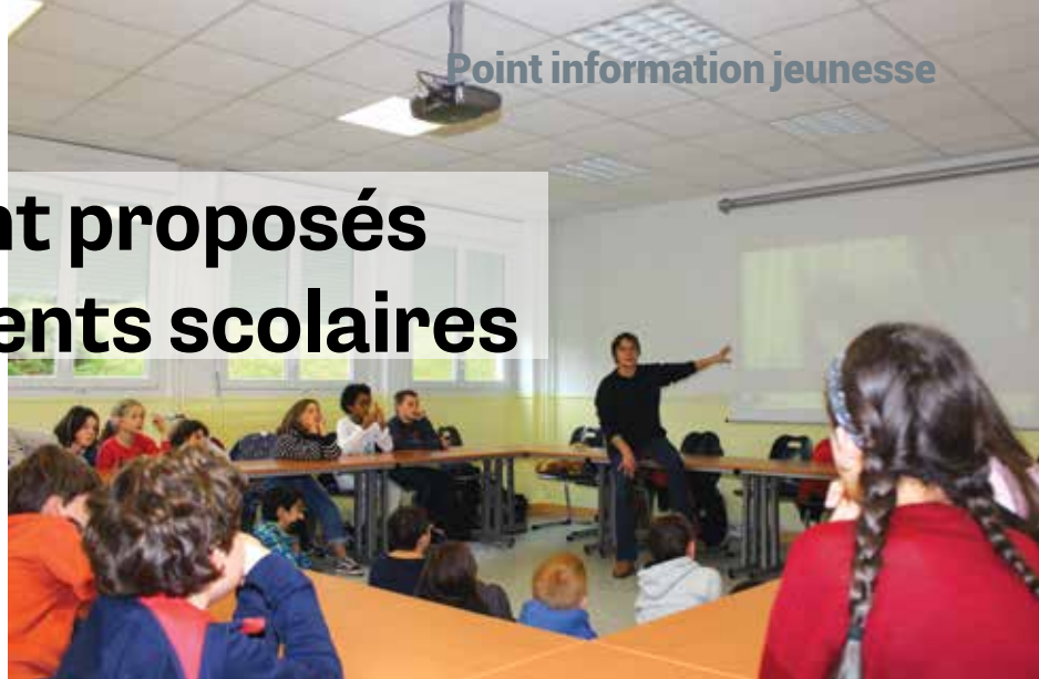
Intervention auprès des 6 è au collège Le Verger.