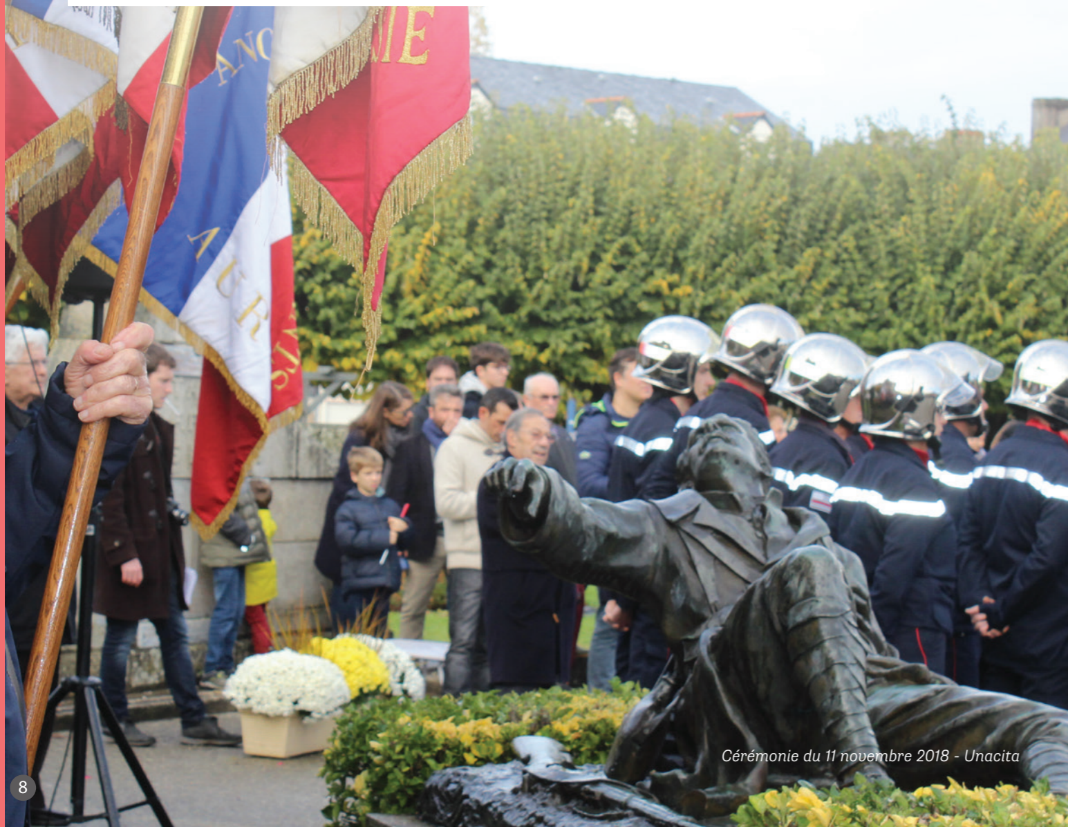
Cérémonie du 11 novembre 2018 - Unacita

Contact : Hocine HADJALI 06 84 08 85 53 / 06 64 51 02 82 hocinemusique@free.fr - http://hocinemusique.free.fr