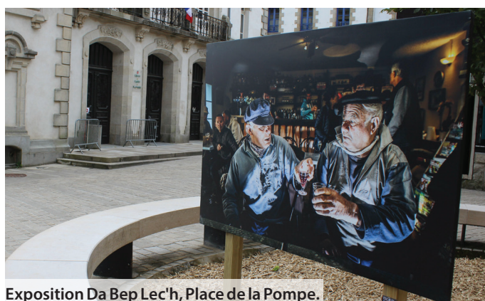
Exposition Da Bep Lec'h, Place de la Pompe.

Des images qui nous amènent à reconsidérer le fragile équilibre de la bande littorale et des terres intérieures qui sans cesse dessinent un paysage unique véritable signature visuelle du territoire : végétal ou minéral, dunes ou marais, plages de sable fin ou estran