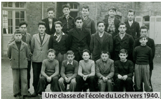
Une classe de l'école du Loch vers 1940.