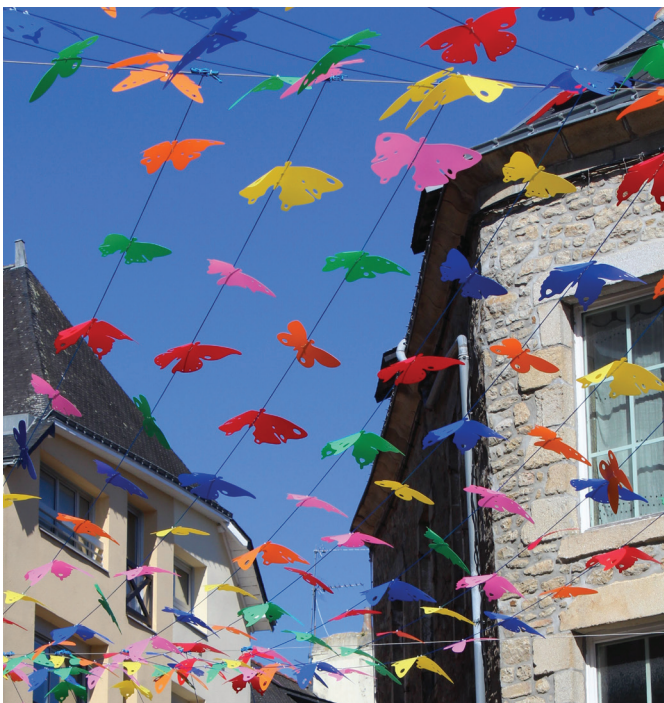
Des papillons ont été installés dans la rue du Lait.