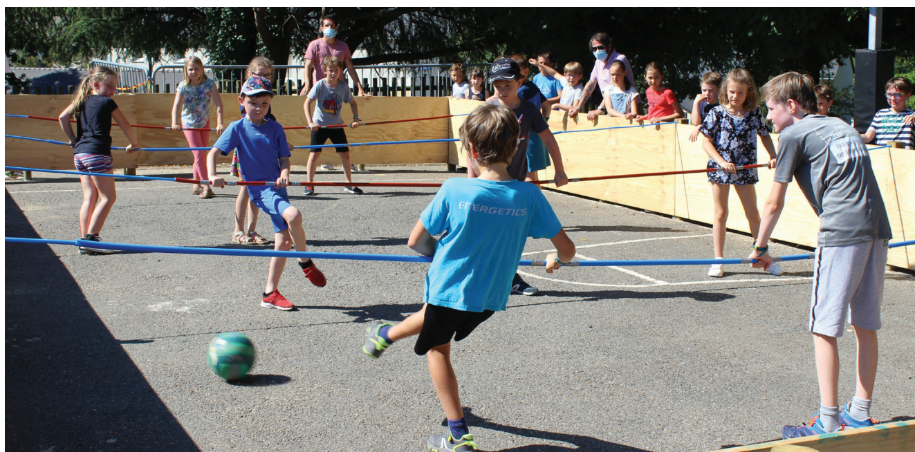
Une nouvelle activité s'est invitée à l'école élémentaire Tabarly et à l'accueil de loisirs : le baby-foot géant.

Maintenir les distanciations physiques et respecter le protocole sanitaire « réouverture des écoles » imposé par le Ministère de l'Éducation nationale, de la Jeunesse et des Sports, tout en proposant malgré tout un sport « collectif » et une activité ludique aux enfants. Voici l'idée qui a motivé la création d'un baby-foot géant dans la cour de l'école élémentaire Tabarly.