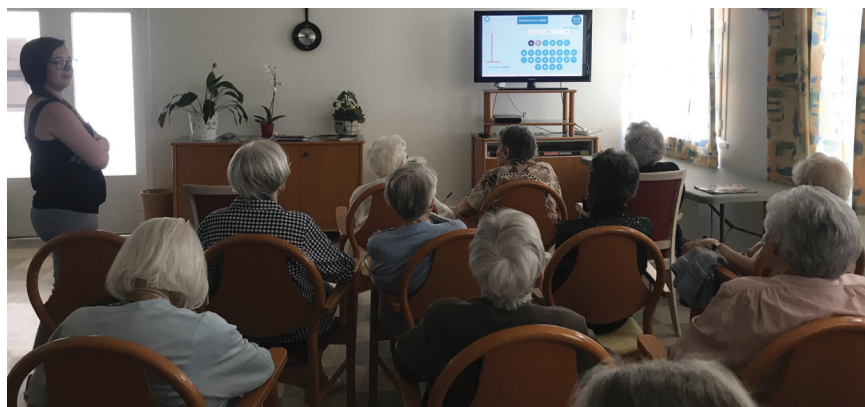
Les résidents du Bocéno réunis pour la dernière manche du jeu.

Les épreuves «Top culture» des olympiades d'été ont été suivies avec beaucoup d'intérêt par les résidents du Bocéno. Depuis 2018, ils participent à ces épreuves inter-établissements qu'ils ont d'ailleurs remportées cet hiver en finissant premier du classement international (des équipes suisses, belges et hollandaises y ont pris part). Cette année, c'est à la 2 e et 3 e position qu'ils accèdent, non sans fierté, tout en se projetant d'ores et déjà sur leur nouvel objectif : les olympiades d'hiver 2021.