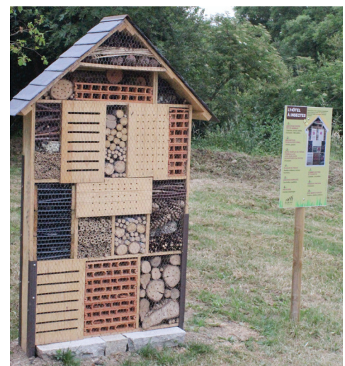
Hôtel à insectes.

L'an prochain, il sera probablement possible (selon la récolte) de goûter le fruit de ce travail lors d'ateliers pédagogiques ou encore d'acheter certains pots au lycée kerplouz.