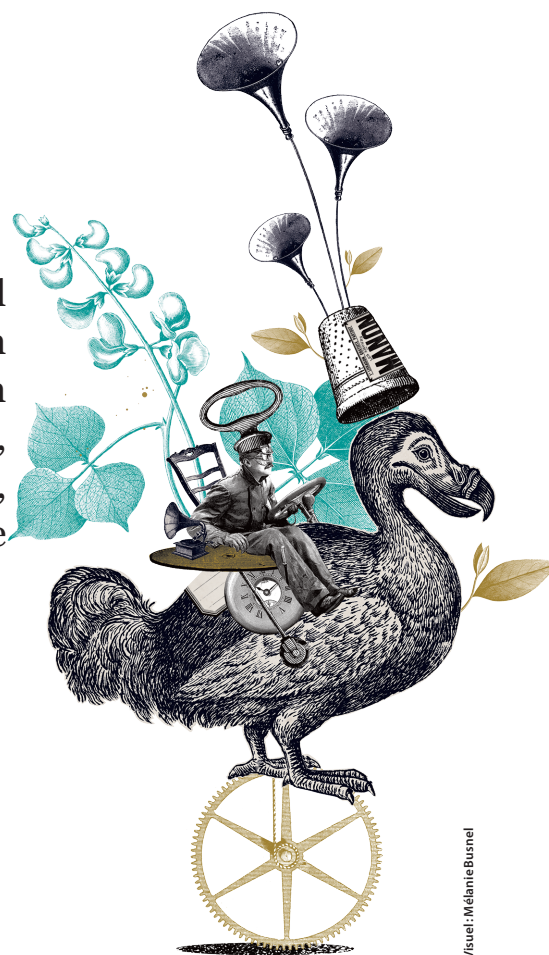
Visuel: Mélanie Busnel

D'autres surprises seront à découvrir début août sur www.auray.fr .