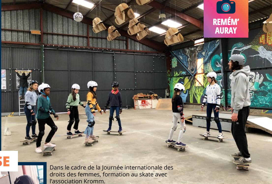
Dans le cadre de la Journée internationale des droits des femmes, formation au skate avec l'association Kromm.