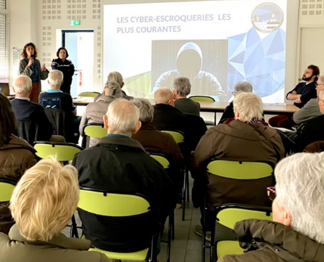
Sensibilisation des seniors à la sécurité sur internet.