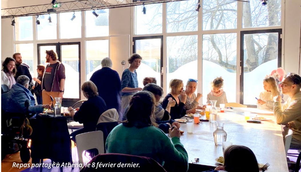
Repas partagé à Athéna, le 8 février dernier.