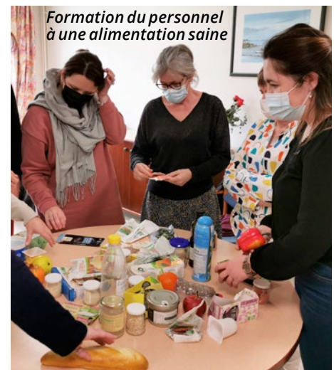
Formation du personnel à une alimentation saine