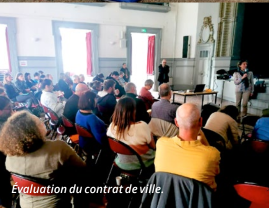
Évaluation du contrat de ville.