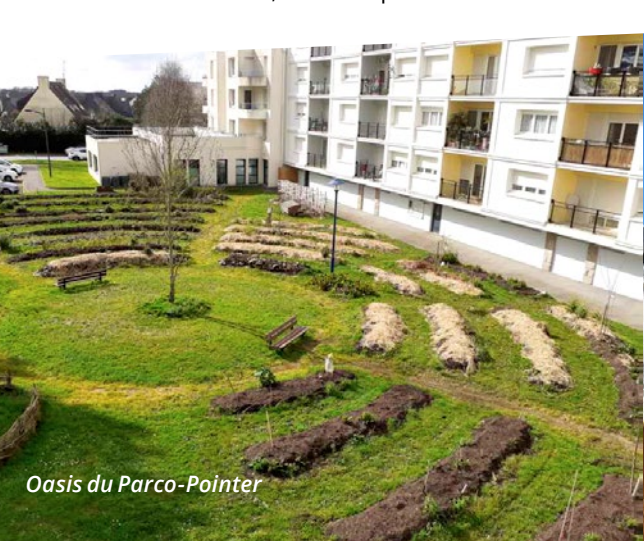
Oasis du Parco-Pointer

À ces mesures, s'ajoutent les modifications apportées au Plan Local d'Urbanisme qui visent à ce que tout projet de construction et/ou d'extension de particuliers, entrepreneurs ou promoteurs prenne davantage en compte la dimension environnementale : instauration d'un coefficient de biotope différencié par surface ; d'une obligation de verdissement pour toute Opération d'Aménagement et de Programmation (OAP) (cf Vivre Auray n°129, page 9 ). ■