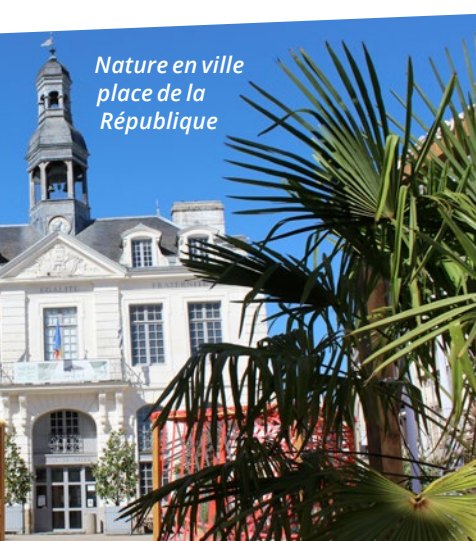
Nature en ville place de la République