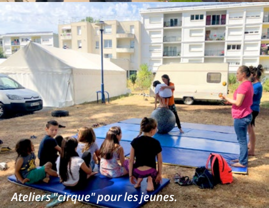
Ateliers "cirque" pour les jeunes.