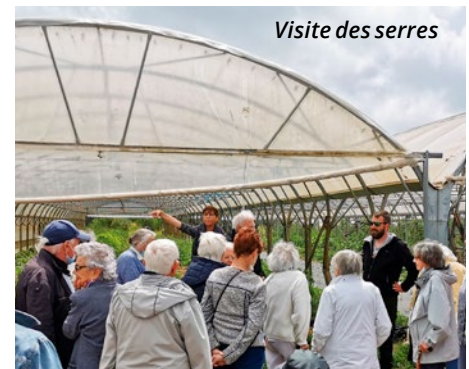
Visite des serres

Le changement va même au-delà des denrées : le multi-accueil a supprimé tous ses contenants alimentaires en plastique. La résidence du Bocéno, de son côté, qui utilisait déjà peu de contenants plastique, a remplacé les bouteilles d'eau en plastique par des pichets en verre et des fontaines à eau. L'objectif est de limiter les perturbateurs endocriniens en utilisant d'une part des produits bio, sans traces de pesticides et d'additifs alimentaires chimiques et d'autre part, en limitant le contact des aliments avec des perturbateurs endocriniens qui ont un réel impact sur la santé. Dans ce changement de pratique alimentaire, la préservation de notre santé, de la biodiversité, de la qualité de l'eau, des emplois locaux mais aussi du plaisir de manger avec des goûts, des couleurs, des saveurs et du partage constitue l'enjeu ! ■