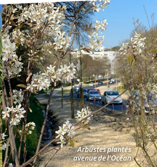
Arbustes plantés avenue de l'Océan