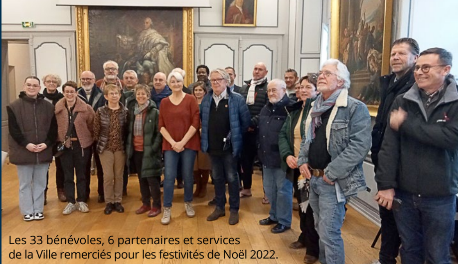
Les 33 bénévoles, 6 partenaires et services de la Ville remerciés pour les festivités de Noël 2022.