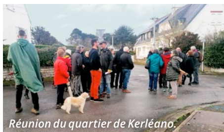
Réunion du quartier de Kerléano.

Le 24 mars dernier était lancé, au départ du Mausolée Cadoudal, le cycle des réunions de quartiers. Les habitants du secteur de Kerléano ont été invités à une marche exploratoire, pour évoquer les questions de "cadre de vie", "mobilité", "logements" et "sécurité" (entre autres). Près d'une centaine d'habitants ont répondu présents à l'invitation. Deux nouvelles réunions seront programmées, d'ici la fin d'année, dans les secteurs de St-Goustan et de la Gare. D'ici la fin du mandat, c'est l'ensemble du territoire alréen qui aura bénéficié d'un temps d'échanges direct avec les élus. ■