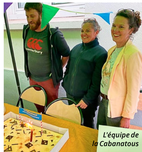
L'équipe de La Cabanatous

L'Assemblée Générale Constitutive aura lieu le samedi 10 juin 2023 à 10h salle du Penher.