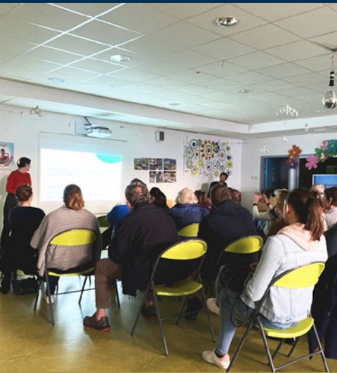
Conférence lutte contre le harcèlement animée par l'association "Colosse aux pieds d'argile".