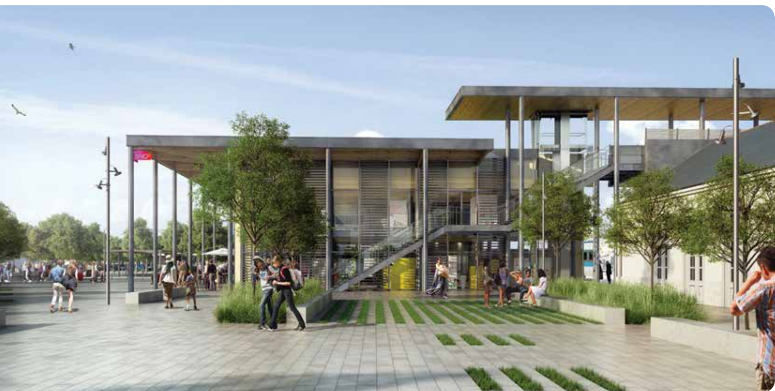
Vue du parvis sud.

Plus qu'une gare c'est un quartier qui va être transformé. La déconstruction du bâtiment désaffecté « Train-Auto-Couchettes » lance les travaux du Pôle d'Échanges Multimodal cette rentrée.