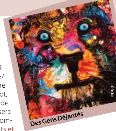
Des Gens Déjantés