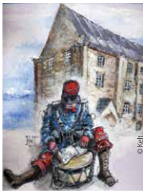
Illustration de l'affiche de l'exposition réalisée par Pascal Kelt.

Quelle était la vie quotidienne des Alréens pendant la Grande Guerre ? Comment vivaient les femmes et les enfants, privés de leurs maris et pères ? Comment furent accueillis les réfugiés du Nord de la France fuyant les combats ? Qui étaient ces internés civils allemands et austro-hongrois incarcérés à la caserne Duguesclin ? Où étaient soignés les soldats blessés ? Comment les soldats prisonniers en Allemagne et dans l'empire austro-hongrois vivaient-ils leur incarcération (souvent longue de plusieurs années) ? Quels étaient les soldats alréens présents dans les zones de combat ? Où étaient situés les cantonnements d'Auray ? Comment fut vécue l'après-guerre, le retour des corps des soldats, la construction du monument aux morts ? Neuf thèmes seront exposés à la chapelle du Saint-Esprit. En