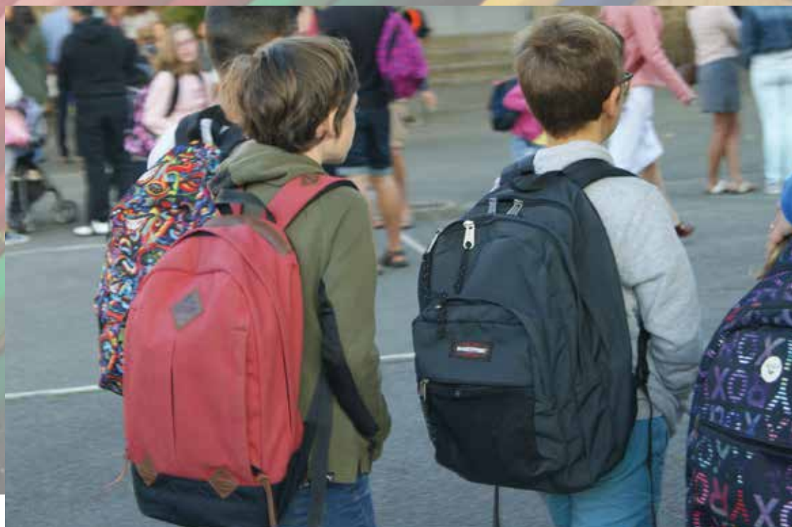
Jour de rentrée à l'école élémentaire du Loch