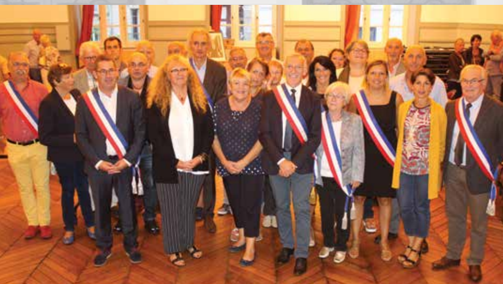
Le conseil municipal renouvelé le 5 septembre.

Avec un bémol : le maire sera autorisé à signer les marchés jusqu'à 50 000 € pour les fournitures et marchés et 150 000 € pour les travaux, contre 100 000 € et 300 000 € auparavant.