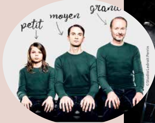
Petit, Moyen, Grand et le Fantôme de l'Opéra