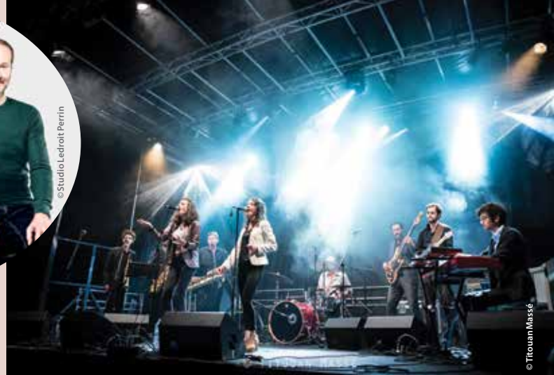
Cut the Alligator

amèneront à considérer la famille autrement. Les acteurs amateurs donnent rendez-vous au public les vendredi 17 et samedi 18 mai .